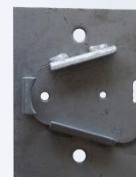
Montageplatte Art.-Nr.: 300 060 002

Innovationen - entwickelt und produziert in Deutschland